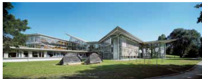
Zentralbibliothek und Sprachenzentrum.