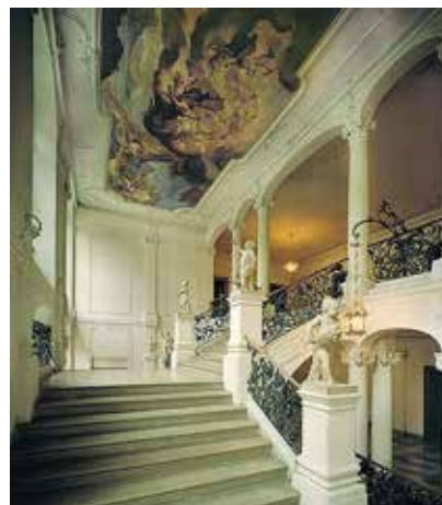
Treppenhaus Residenz